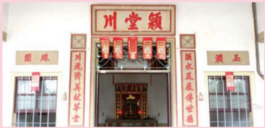
▲五福符五個一組貼在門楣上，用以迎福辟邪。

五福符又稱五福箋、五福紙等，它是傳統的門楣吉祥飾物，一般用紅紙或彩紙剪刻而成，有些是五張五色（紅、洋紅、粉紅、黃、綠），有些則是五張皆為紅色，上面印有「天官賜福」、「金玉滿堂」、「五福臨門」、「福祿壽喜」字樣和「財子壽」的圖案。更加講究者，還會用剪紙、或者結合版畫，製作財子壽、八卦、蝙蝠、牡丹花卉、蝴蝶、喜鵲、金錢等吉瑞圖案，增加