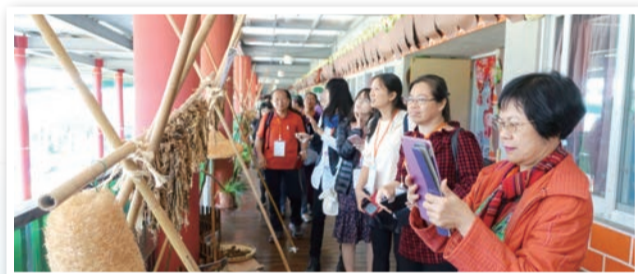
▲與會教師觀摩東勢幼兒園環境營造成果

各一所國小試辦客語教學計畫；廣續為臺中山城地區打造優良大埔客語師資及在地化教材，讓本市山城區的客語示範幼兒園成為客語復甦的利基，並達到保存臺中特有的大埔客家文化。