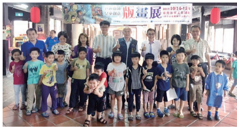
▲參展學童與來賓開心合影

東勢客家文化園區是在地客家文化推廣平台也是臺三線南面的入口，本次的展覽除提升客家館舍的藝文色彩外，亦提供在地學童展現藝術創作的舞台；作品内容除有學童喜愛的休閒活動：「抓甲蟲」、「跳繩」、「跆拳道」外，亦有「太空之旅」、「幻想」、「古代世界」等充滿想像力的題材，各作品用色大膽活潑，帶有原住民色彩鮮明的多元風格，展現孩童極富創新、創意的一面！