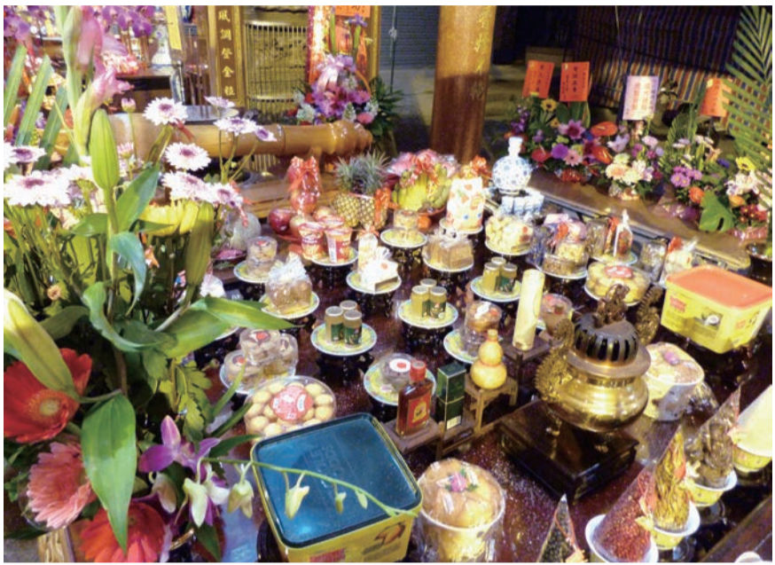
▲拜三官大帝的供品特別豐富

只要走訪傳統客家夥房的公廳，注意看燈樑的左右兩邊，除了懸掛一對夥房主人的姓氏燈之外，通常還可以見到一對黃色的紙燈籠，上面寫著「三官大帝」大字，這也代表典型客家夥房獨有的特色。