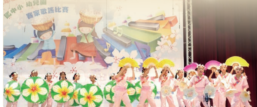
▲表演類比賽舞台妝扮色彩繽紛

本次活動山城及市區各有一所私立幼兒園報名參賽，第一次參與演出，表現就深獲肯定。會場擠滿各校為孩童加油打氣的家長，讓舞台上的小朋友們更加賣力地舞動手腳，舞台魅力爆表，熱情支持的盛況顯示出客家歌謠的推廣成功與客家文化永傳！