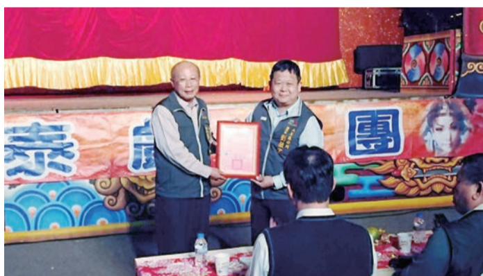
▲本會劉主委致贈大里區公所感謝狀

此次收冬戲是首次於大里地區舉辦，活動由表達祈願的「扮仙」揭開序幕，藉此為民眾賜福；接著演出正劇，觀眾們沉浸在精彩的客家戲曲中，隨著臺上的劇情心潮起