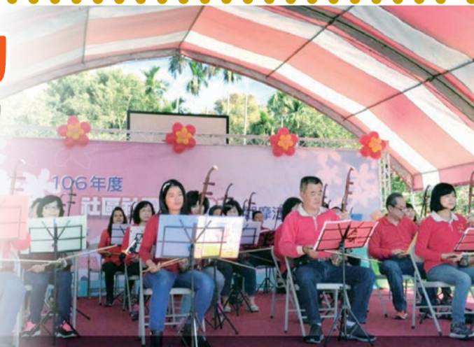
▲二胡演奏－胡琴國樂班

動成功將客庄社區各班隊年度學習成果以動態表演及靜態展示，呈現出客家人的好客及客家文化內涵之美。