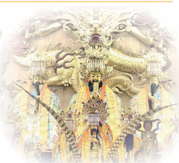
▲三官大帝客家人習稱三界爺

農業時代到現在，三官大帝一直是客家普遍供奉的神明，不過，供奉的型態不同於閩南族群在公廳上放置神像，客家人的信仰有所謂「祖在廳，神在廟」的習慣，也就是說，重視祭祀祖先甚至超過神明，因此，很少見到在公廳供奉神明金身的習慣。