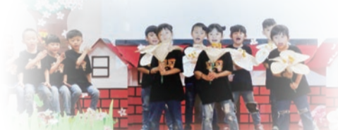
▲浣熊班小朋友熱情開場

未來持續推動客語沉浸式教學計畫，並規劃於107年達成14園27班目標，且於東勢及石岡區公立幼兒園全面實施客語沉浸式教學。另為延續幼童客語學習軌跡，規劃於東勢及石岡區