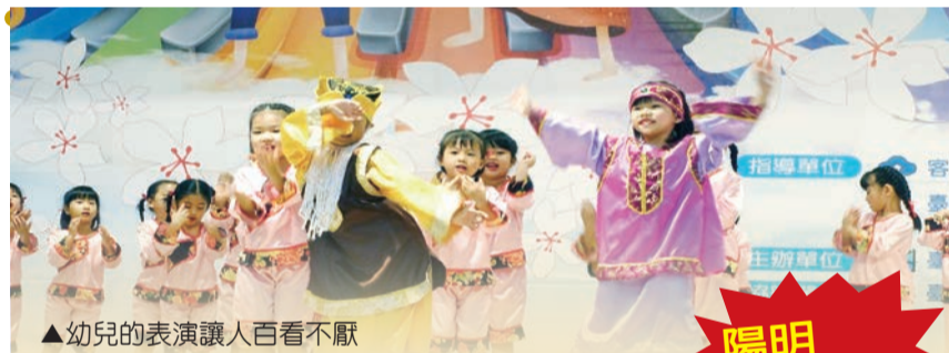
▲幼兒的表演讓人百看不厭