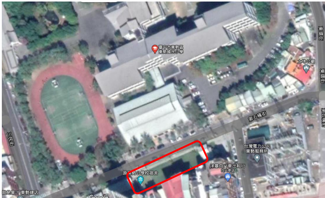
圖 4：歷史建築平面配置圖