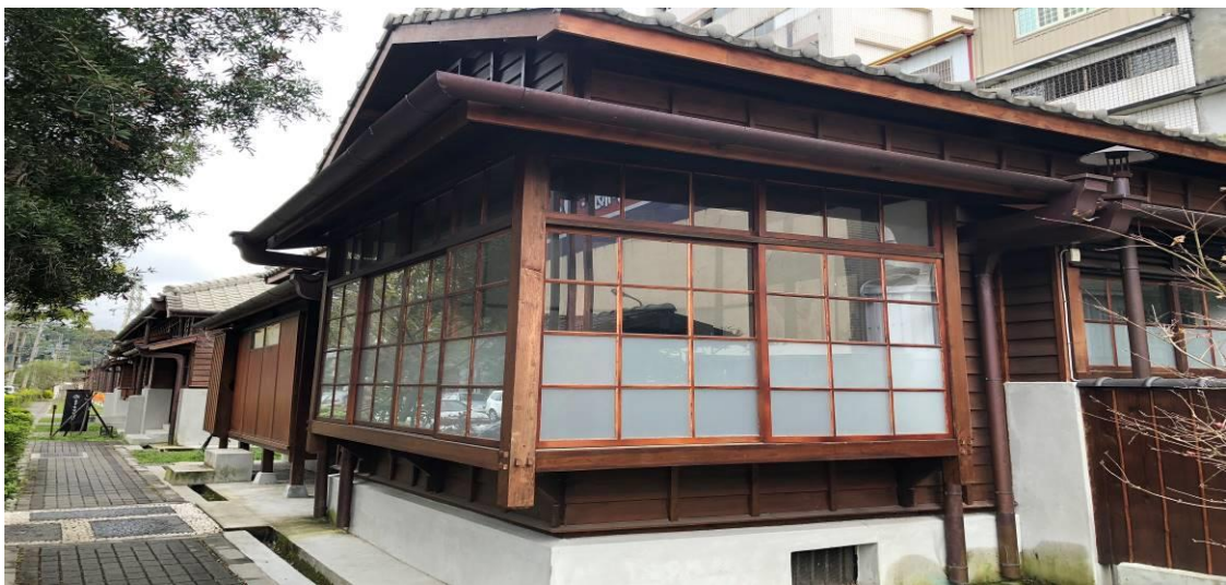
圖 1：古蹟歷史建築代表圖照

宿舍群建物採用檜木構造，材料具有反映當時代之歷史意義。且至今仍然保存原有日式工法及材料，極有日治時期建築技術研究價值，宿舍群與東勢地區教育發展息息相關，與東勢客家庄文化之推動更有密不可分的歷史情緣，可說是東勢地方文史研究上之重要證物。