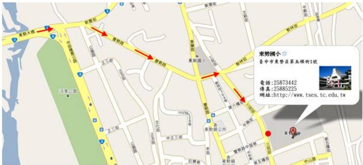
圖 2：歷史建築位置圖

東勢六合段 165、166、171 地號內，房舍係指東勢區第五橫街 2 號、12、14 號雙併、16 號。臨三民街與第五橫街。