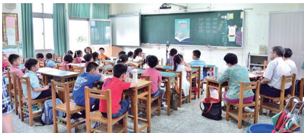
▲今年在校方及家長鼓勵下，參賽學生較去年增加近3成。

學生較去年增加近3成，不論山城客家重點發展區或市區非客家重點發展區均有成長，足見本活動已漸漸打破語言與族群間的藩籬，讓多元文化在本市共存共榮。