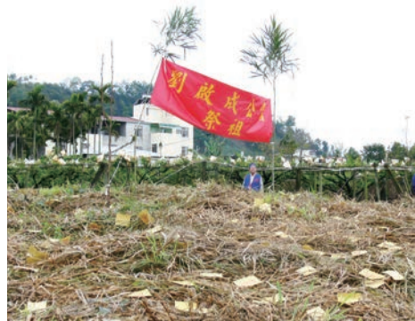
▲石岡土牛劉屋家族主要的掛紙祭祖固定在春分舉行

客家家族的公嘗是家族共同祭祖的組織。也是祭祖經費來源，在現代社會要維持淵遠流長的傳統公嘗，持續正常運作而發揮凝聚親族情感共同慎終追遠的功能，是非常不容易的事。基本上必須有一筆長期穩定可靠的祭祖經費來源作為後盾，公嘗就是客家家族專用於祭