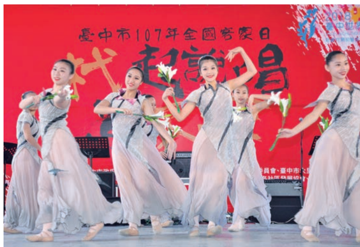
▲以花卉舞蹈表演宣傳臺中2018花卉博覽會