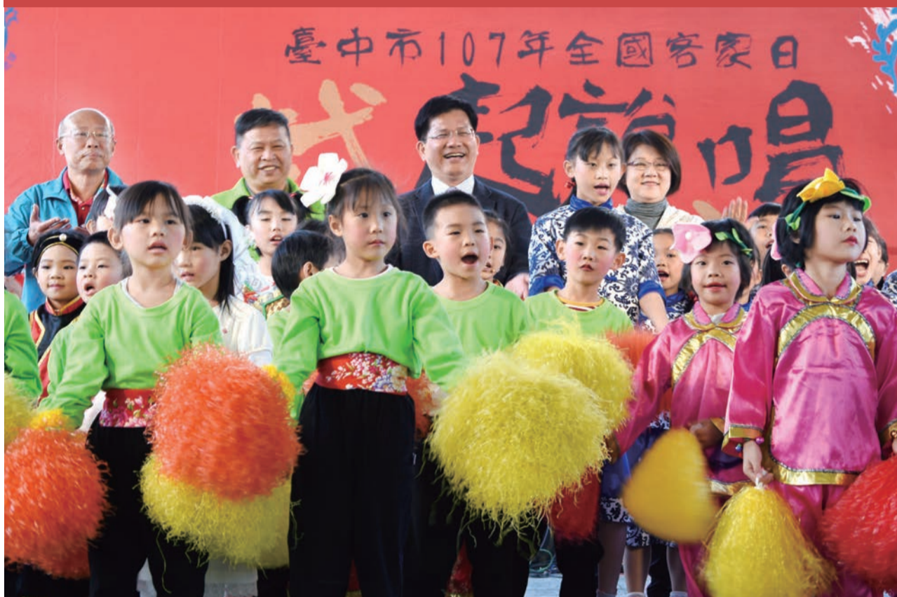
▲臺中市全國客家日移師大里，市長林佳龍與小朋友合唱客家歌謠。