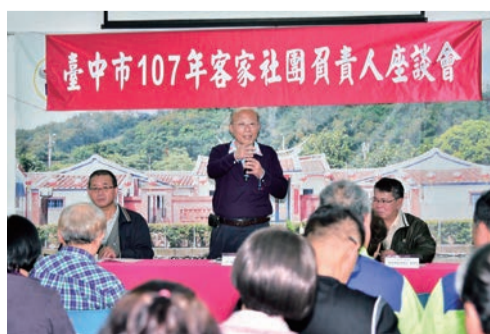
▲本會劉主委感謝各社團長期以來協助推動客家文化