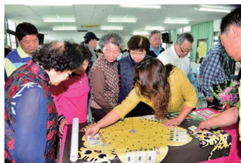
▲活動帶動人潮，讓客家文化在一般大眾週遭永續傳承。

以及鄰近區里間資源，積極推廣客家文化，也透過活動帶動人潮，使更多人去接觸、了解，進而對客家文化認同，讓客家文化在一般大眾週遭永續傳承。