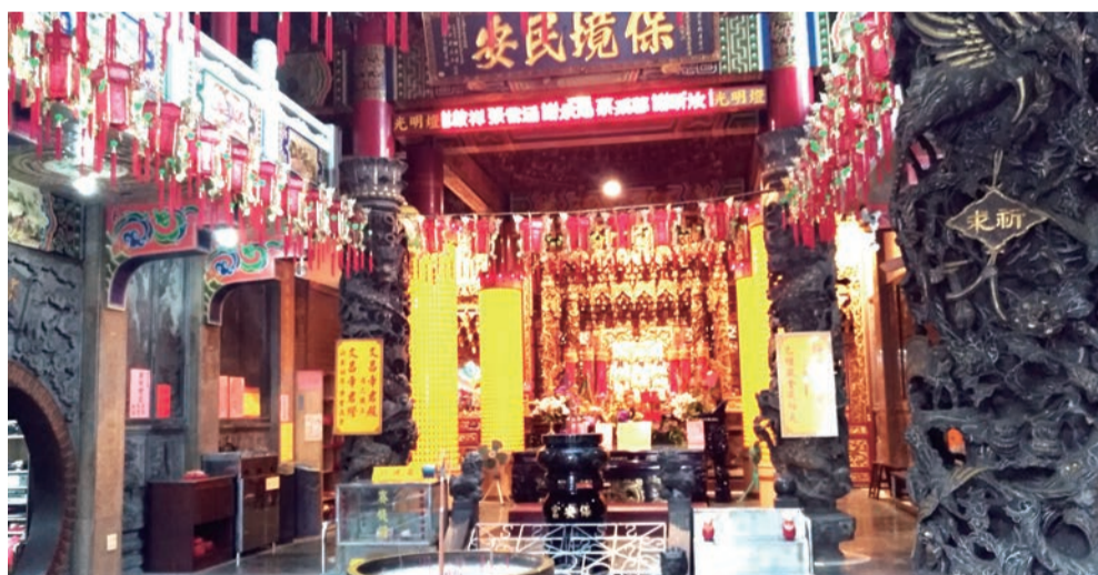
▲沙鹿保安宮三山國王廟

本廟祀奉的巾山國王、明山國王及獨山國王，不只長久庇佑著當地居民，也見證這片土地的歷史變遷與民族融合，無疑是海線珍貴的人文資產。