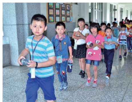
▲鼓勵小朋友開口說客語，做好客語扎根、語言傳承的工作。

學生較去年增加近3成，不論山城客家重點發展區或市區非客家重點發展區均有成長，足見本活動已漸漸打破語言與族群間的藩籬，讓多元文化在本市共存共榮。