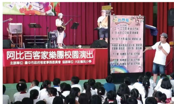
▲阿比百樂團到大肚國小演出