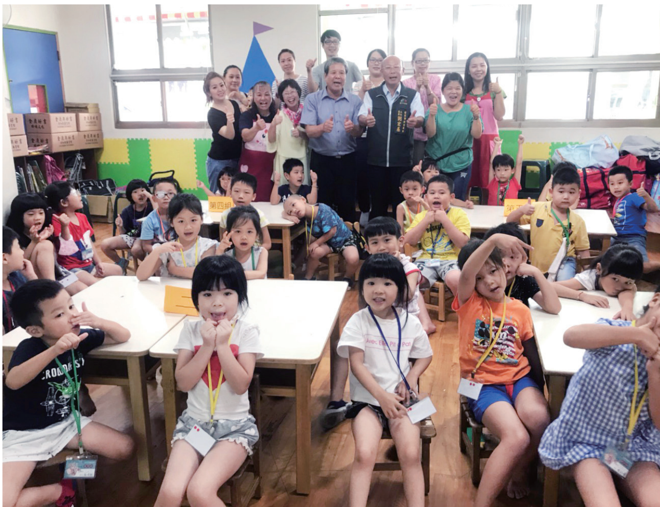
▲本會與幼兒園合辦文化夏令營，啟發孩童客家文化興趣。

活動安排傳授客家語言、歌謠傳唱、歷史文化、客家美食及吊飾、紙傘彩繪等傳統客家藝文創作。以輕鬆、活潑及多樣化的教學方式，啟發小朋友對客家文化的興趣，不僅讓每一位參加者都能帶著愉快的心情與滿滿的知識收穫而歸，更將客家文化的色彩點綴在炎炎夏日中，陪伴學童度過一個充滿客家風情的暑假！