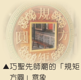
▲巧聖先師廟的「規方圓」意象

本會曾於2013年舉辦「匠寮文化祭」，訪客穿梭於巧聖仙師廟與文化街，感受獨特的文化節慶、農特產品及客家美食，見證東勢發展的歷史軌跡。