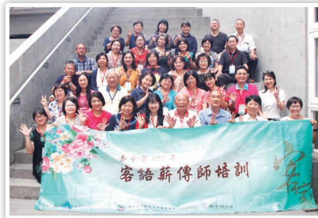
▲劉主委與薪傳師、講師合影