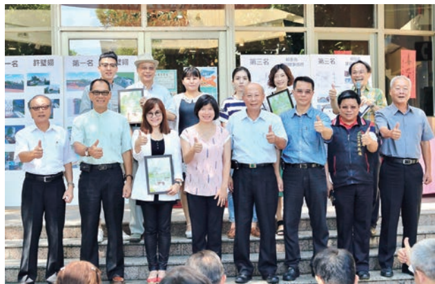
▲「浪漫台三線」南口改造創意競圖發表

「國家級臺三線客庄浪漫大道」由北至南，經過桃園、新竹、苗栗到臺中；桃園、新竹、苗栗皆以「茶」廊道為論述主軸，而臺中係以「里山客庄、花果臺中」廊道主軸來區別論述，因此本市的发展特色