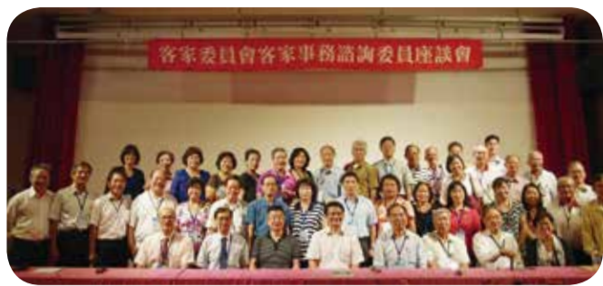
▲103年客家事務諮詢委員會全體委員合影

鳳凰颱風剛走，客家委員會主委劉慶中隨即南下屏東六堆客家文化園區，與嘉義、台南、高雄以及屏東等地的客委會客家事務諮詢委員進行座談，劉主委表示，會中所有的意見都將作為客委會未來施政參考，希望藉此建立起中央與地方的溝通平台，讓客家事務推動更順利、更圓滿。