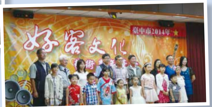
▲歌唱比賽少年組得獎者合影

「臺中市2014年好客文化藝術嘉年華會-客家歌謠歌唱比賽」於10月10日至10月12日三天在本市東勢區農會農民活動中心辦理，比賽組別分為少年組、青年組、壯年組及長青組。近年來由於客家文化蓬勃的發展，客家音樂也漸漸深入社會各個階層，甚至許多非客家族群也開始參與客家歌謠研習班的活動。希望藉歌唱比賽寓教於樂，進而達到普及客家歌謠傳唱與以歌會友之目的。