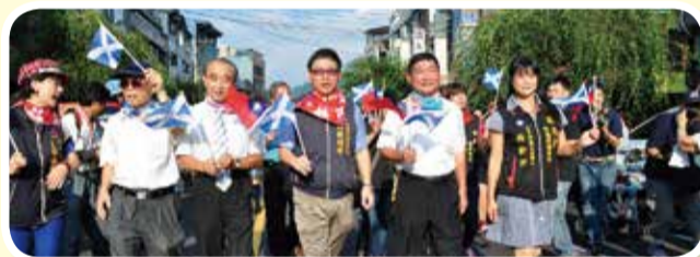
▲由中央客委會鍾副主委、臺中市政府客委會賴主委、文化局葉局長等貴賓帶領客家藝文團隊於東勢商圈踩街！

胡市長也於活動中特別致贈富有客家文化特色的花布領巾予蘇格蘭風笛樂團，團員並於當日晚間表演時，以客家花布領巾亮相裝扮表演，廣受好評！不僅促進了異國文