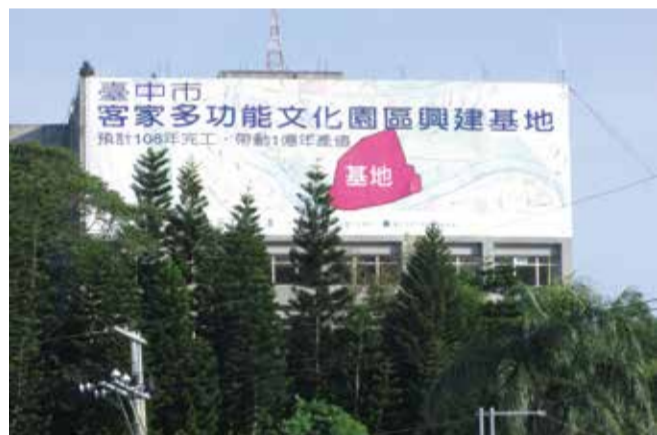
▲客家多功能文化園區

臺中市客家人口數約43.9萬人，佔本市人口比例約16.3%，本市山城區更是全國大埔客語族系最集中的地區。鑑此，客家文化的保存、傳承與發揚，是建設臺中市為「文化城市」不可或缺的一環，然本市雖有為數眾多之客家人，其硬體建設仍較貧弱，無以凸顯及搭配文化軟體之進行，因此，自從胡市長就任大臺中直轄市第一屆市長後，積極推動客家事務，朝向傳承與發揚客家文化，繁榮客庄產業，保障客家族群集體權益，建立共存共榮之族群關係而努力。