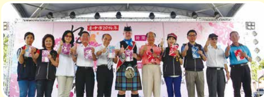
▲胡市長志強、中央客委會鍾副主委萬梅、臺中市政府客委會賴主委朝暉等貴賓和蘇格蘭風笛樂團團長合影。